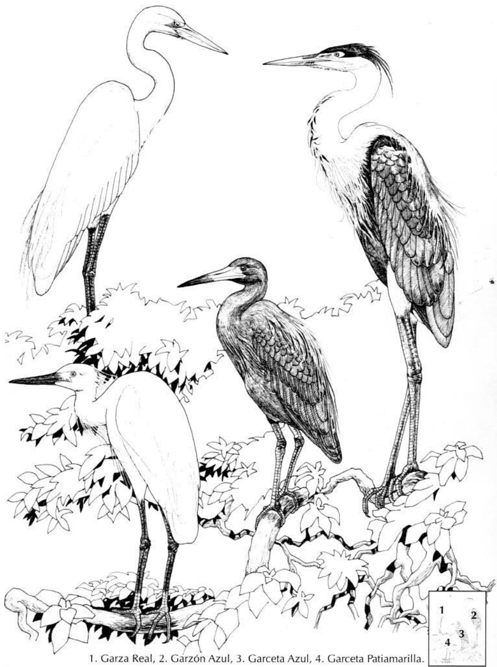
1. Garza Real, 2. Garzón Azul, 3. Garceta Azul, 4. Garceta Patiamarilla.