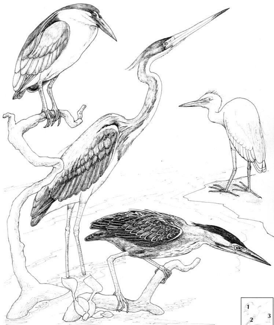
1. Guaco o Garza Nocturna, 2. Garza Tricolor, 3. Garza del Ganado, 4. Garcita Rayada.